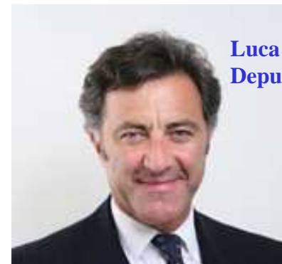
Luca Barbareschi Deputato PDL